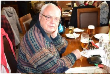
Nejvíce se pilo točené pivo Starobrno 11° (29,- Kč).