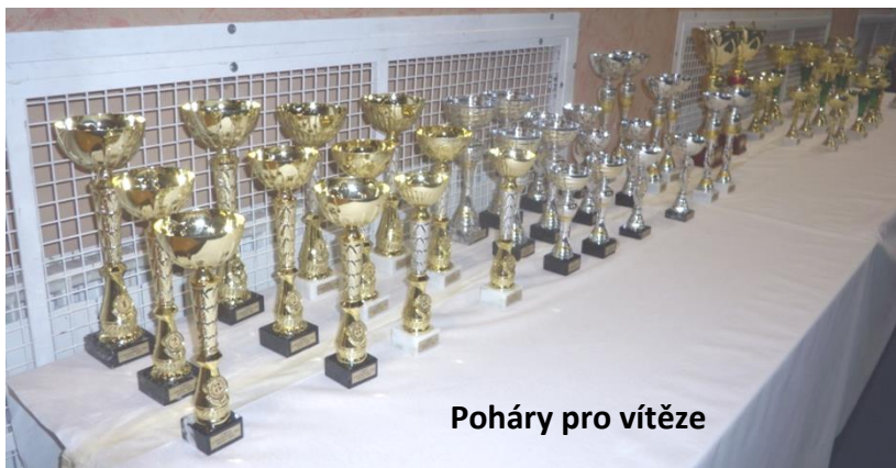
Poháry pro vítěze